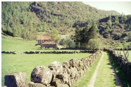
Garden Bjordal innerst i Ørsdalen.

Nye bilder legges ut fortløpende, så følg med!