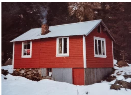
Hytta på Espenes i Bjordal. Den hadde aldri strøm innlagt, men senere brann den ned, som aldri ble oppklart.