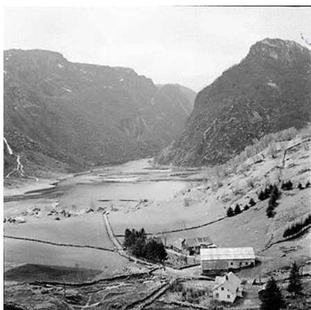
Utsikt fra garden og utover mot Ørsdalen 1980.