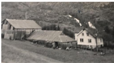
Bjordal – garden til Anstein og Liv Hovland.