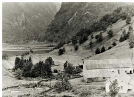
Bjordal på 1950-tallet.